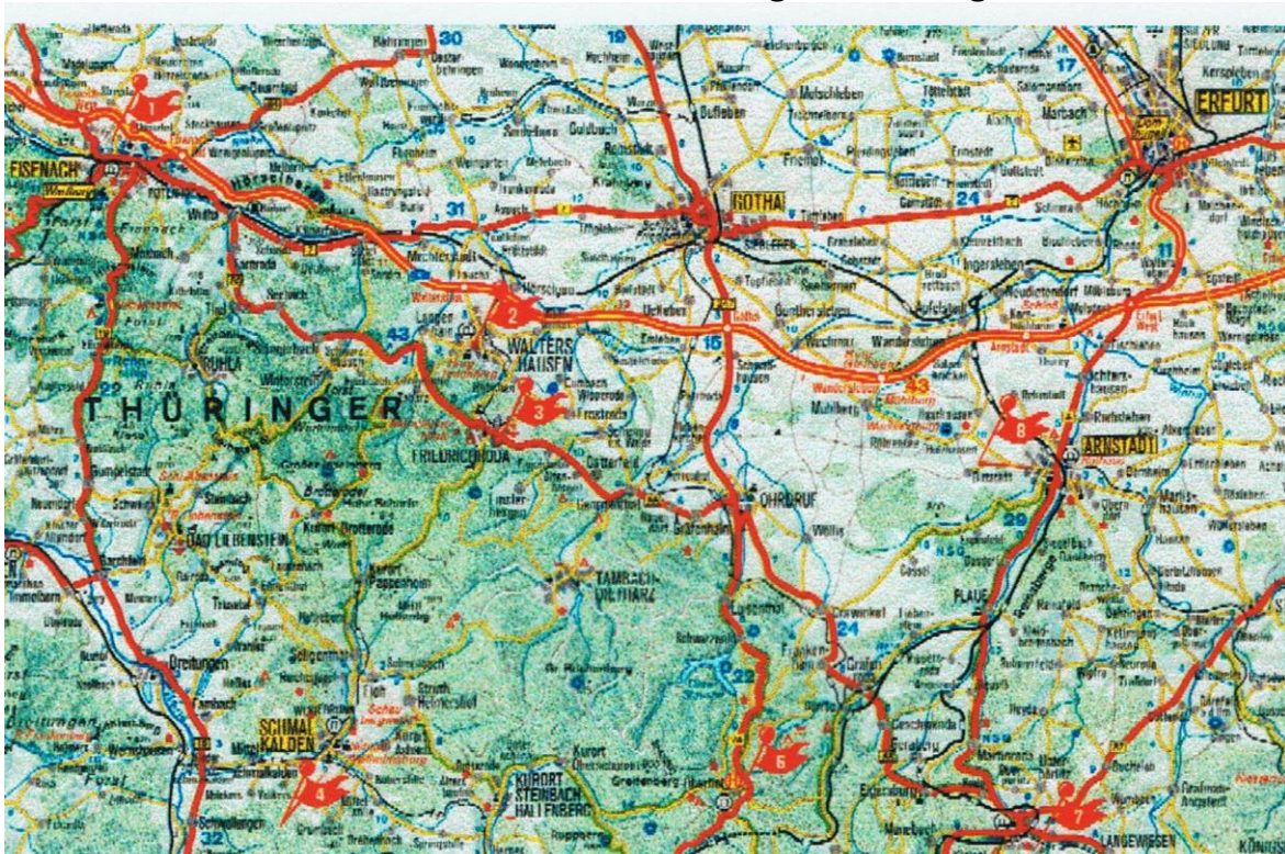
Abb. 5 Eckharts Heimat

thüringischen Adelsgeschlecht derer von Hochheim. Es kann im Jahre 1260 gewesen sein, daß er auf der Burg Waidenfels bei Tambach am Inselsberg geboren wurde." Dies vor sechzig Jahren! Es ist also sicher geboten, alle Daten und Fakten nicht nur zu Eckharts Geschichte mit einem großen Fragezeichen zu versehen. Dieses Lehrstück in Sachen wissenschaftlich-historischer Redlichkeit und Gründlichkeit läßt vermuten, daß vieles nur sehr vorläufig festzuhalten geht.